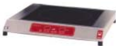
PIANO DI COTTURA AD INDUZIONE ART. 49998-03 VEDI PAG. 24 INDUCTION COOKER ITEM 49998-03 SEE PAGE 24