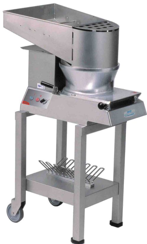
TR260 + S/S TROLLEY