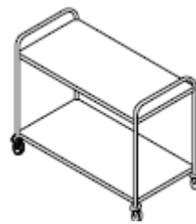
Carrello a due piani