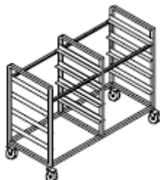
Carrello portacestelli lavastoviglie doppio basso