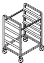
Carrello portacestelli lavastoviglie singolo basso

STRUTTURA: vano rientrante. 2,5 mm laterale piano 18 mm anteriore piano 2 mm posteriore piano; Costruzione a pannelli portanti saldati; Fianchi con controfianchi interni AISI 304 SB 8/10; Schienale AISI 304 SB 8/10; Suola AISI 304 SB 8/10; Struttura di base in lamiera alluminata 18/10 incrociata e avvitata alla suola con predisposizione al montaggio di piedini, ruote, zoccoli inox, zoccoli in muratura, zoccoli smontabili Traversa saldata autoportante