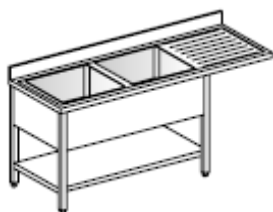
Lavatoio Su gambe, 2 vasche, gocciolatoio destro e ripiano inferiore