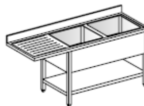
Lavatoio Su gambe, 2 vasche, gocciolatoio sinistro e ripiano inferiore