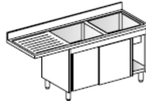
Lavatoio Su armadio, porte scorrevoli, 2 vasche, gocciolatoio sinistro