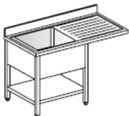
Lavatoio Su gambe, 1 vasca, gocciolatoio destro e ripiano inferiore

AISI 304 SB sp 10/10 Invaso con gocciolatoio stampato vasche saldate con foro scarico, piletta e troppopieno rinforzi longitudinali e trasversali in AISI 304 Alzatina H100X15 chiusa posteriormente con AISI 304 Foro per rubinetti o miscelatori monoforo, diametro 34 mm. Foro per rubinetti o miscelatori biforo, variabile con il modello. Costruzione a pannelli portanti saldati Fianchi con controfianchi interni AISI 304 SB 8/10 Schienale AISI 304 SB 8/10 predisposto x collegamenti idraulici Suola AISI 304 SB 8/10 Struttura di base fe alluminio 18/10 incrociata e avvitata alla suola con predisposizione al montaggio di piedini, ruote, zoccoli inox, zoccoli in muratura, zoccoli smontabili Traversa anteriore saldata autoportante Porta in AISI 304 SB sp 8/10 Contoporta interna in aisi 304 BA sp 8/10 Insonorizzazione con poliuretano iniettato Impugnatura incassata a tutta altezza; Scorrimento superiore con cuscinetti regolabili rivestiti in pvc su guide AISI 304 a V smontabili; Scorrimento inferiore con pattino in pvc su guide a doppio canale in pvc