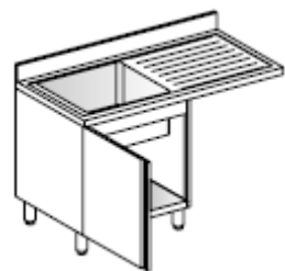
Lavatoio Su armadio porta a battente, 1 vasca, gocciolatoio destro