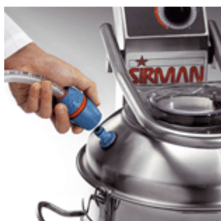
Attacco rapido entrata acqua