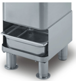
Cavalletto con setaccio opzionale