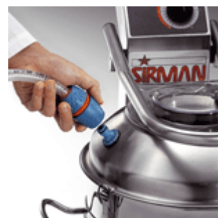
Attacco rapido entrata acqua

ATIS S.r.l. - Via. Pontebbana, 19 - 33098 Valvasone (Pn) - Italy - P.IVA 0163350937